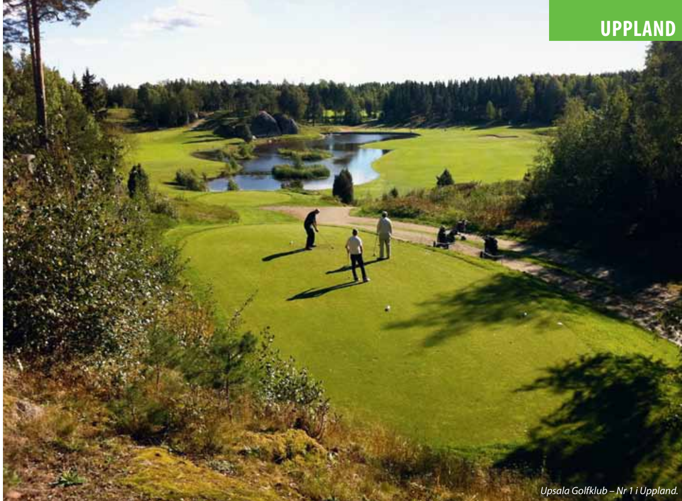
Upsala Golfklub – Nr 1 i Uppland.