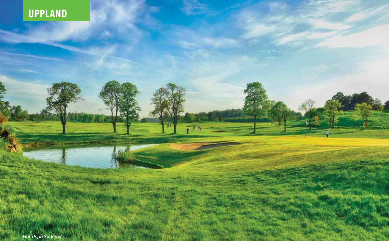
Hul 18 på Söderby.