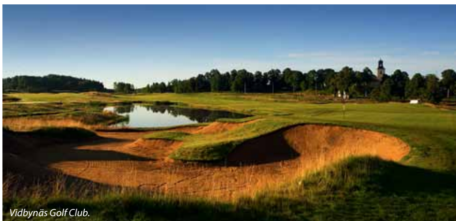
Vidbynäs Golf Club.