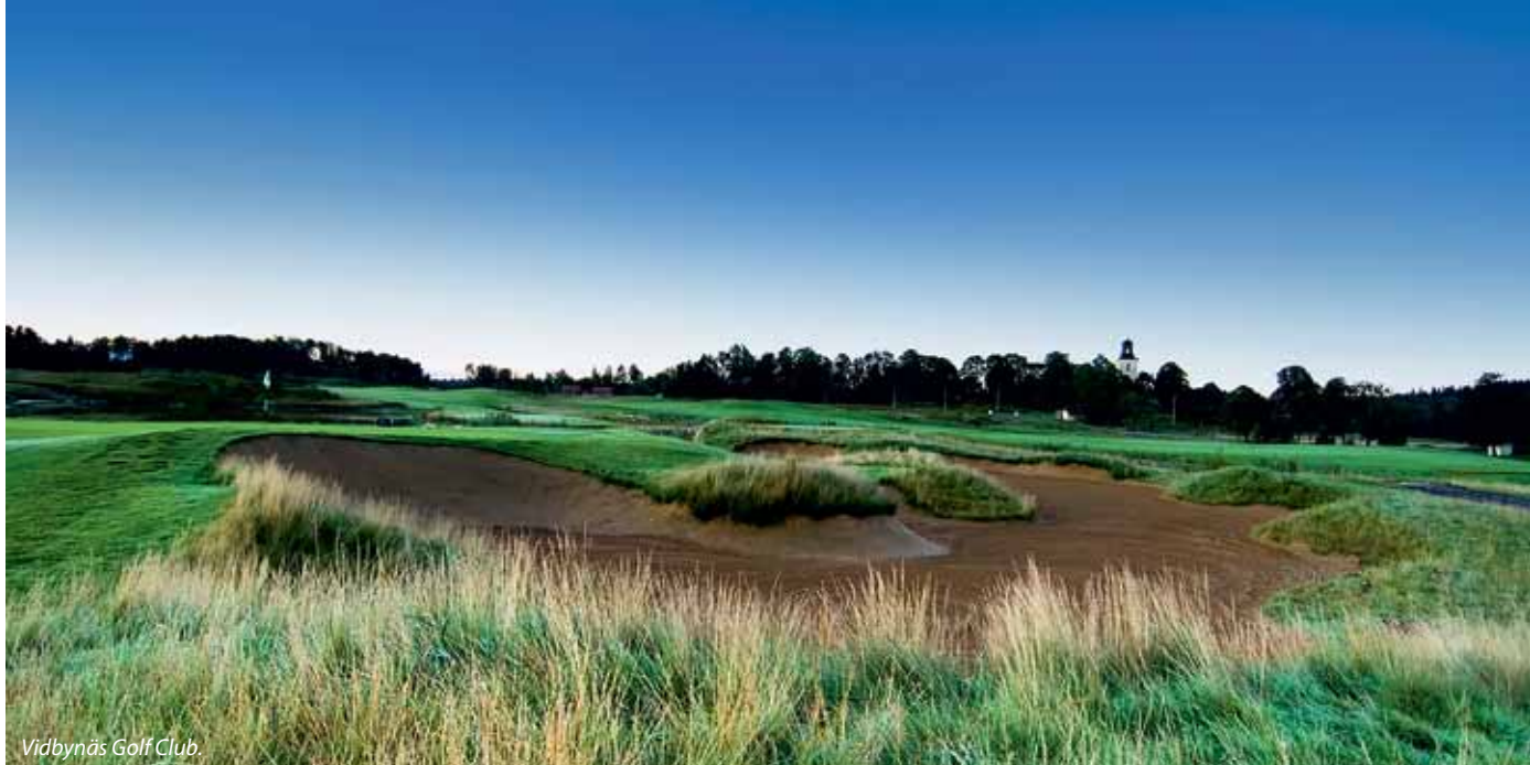
Vidbynäs Golf Club.