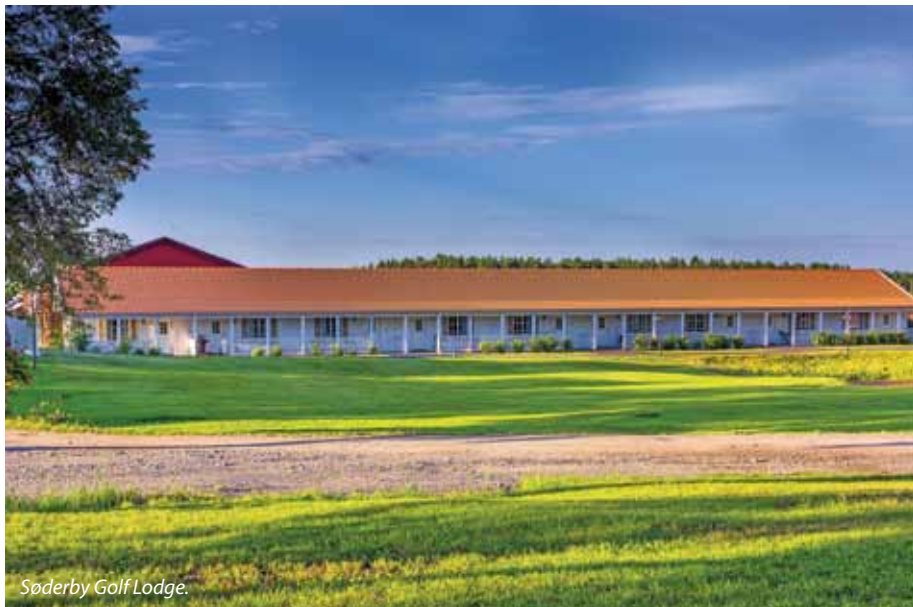
Söderby Golf Lodge.