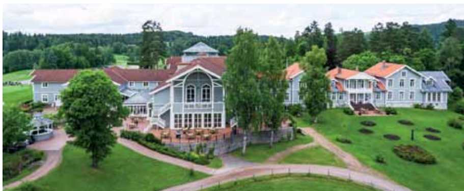
Losby Gods tilbyr golfpakker. Se www.losbygods.no .

Banen er åpen for Pay & Play, og kan også tilby footgolf på en bane som går parallelt med golfbanen.