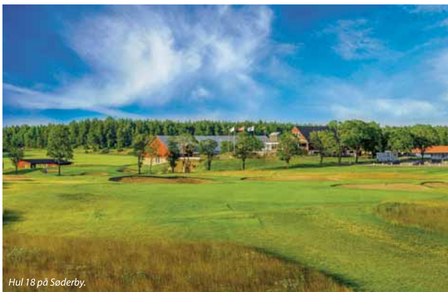
Hul 18 på Söderby.