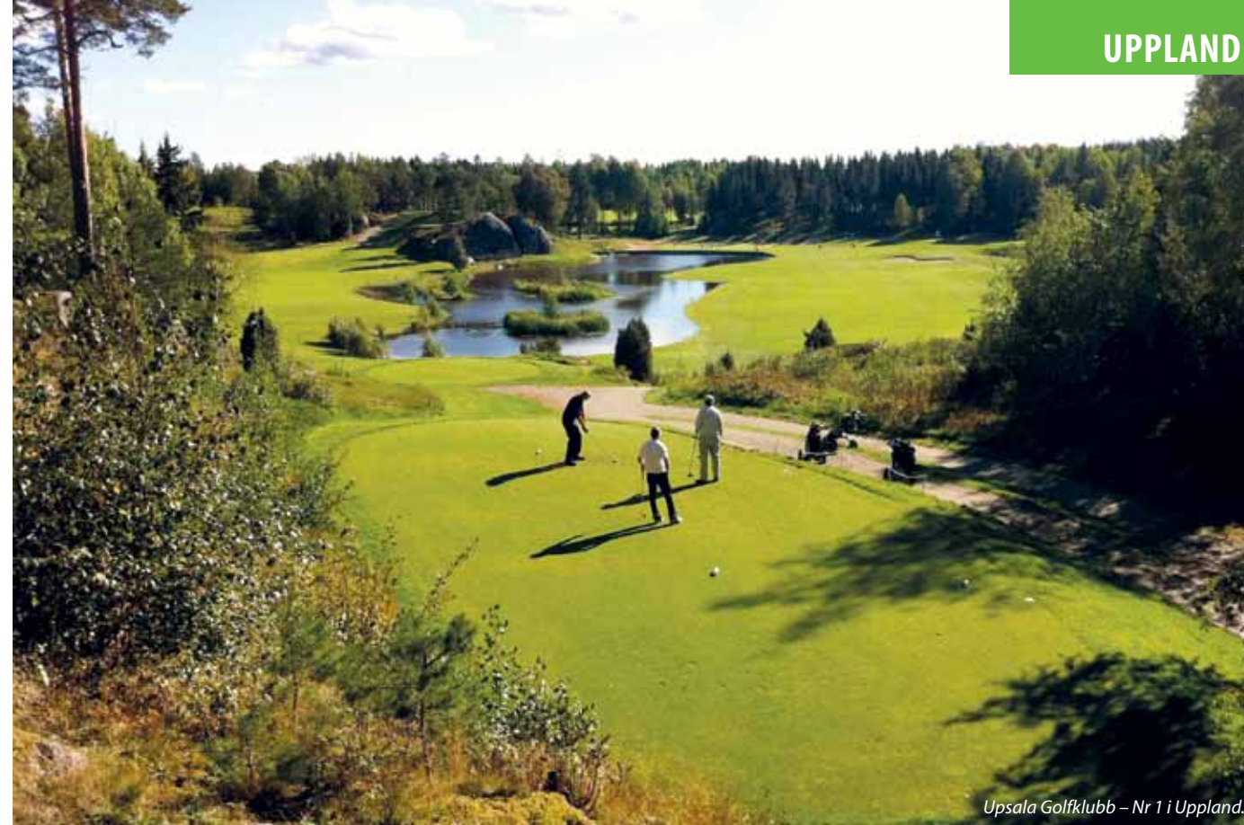
Upsala Golfklubb – Nr 1 i Uppland.