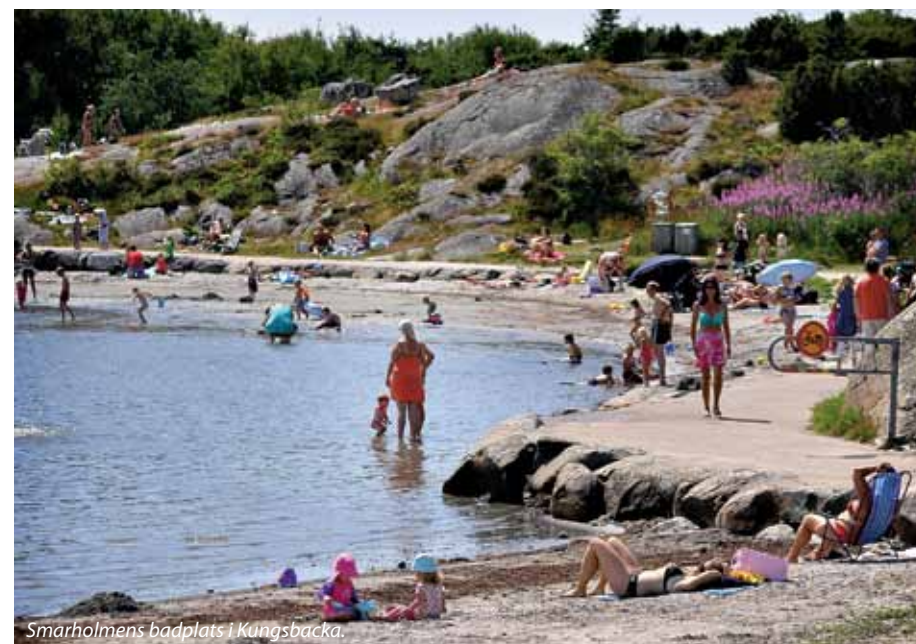
Smarholmens badplats i Kungsbacka.

Kungsbacka GK er den mangfoldige klubb, du aldri blir trøtt av.