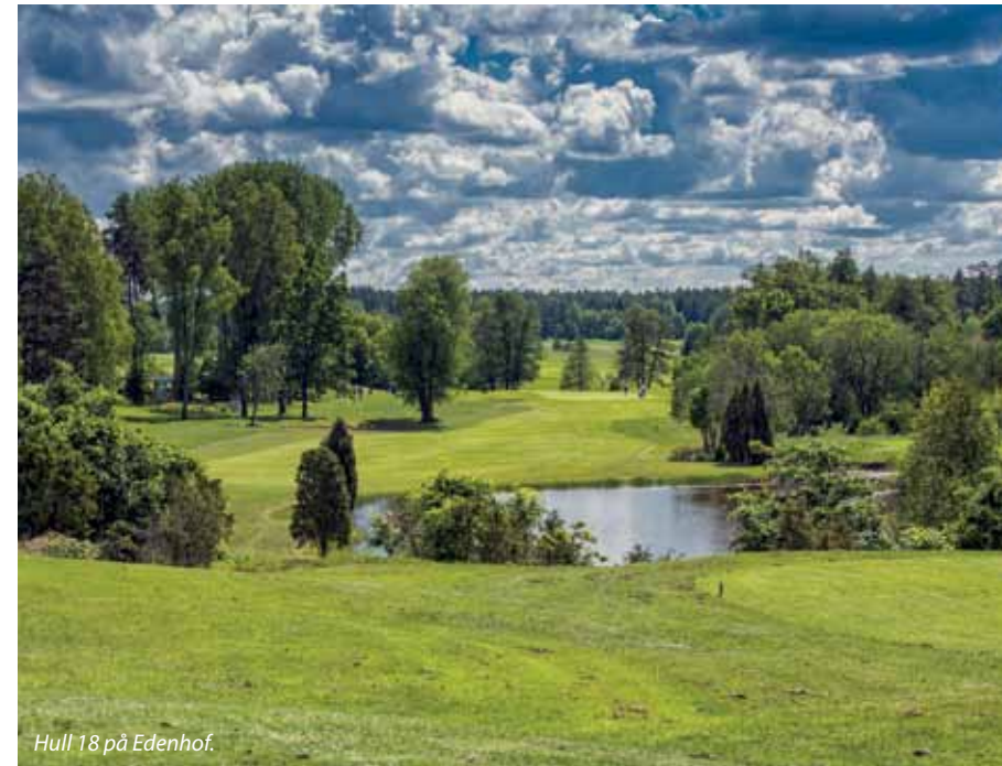
Hull 18 på Edenhof.

Klubben har dessuten tre gange vært vert for Europatouren i Handigolf.