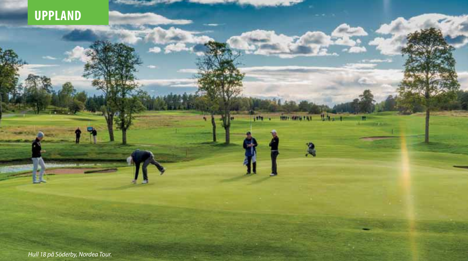
Hull 18 på Söderby, Nordea Tour.